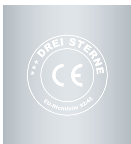
مطابق بارده بندی سه ستاره بختنامه بهره‌وری