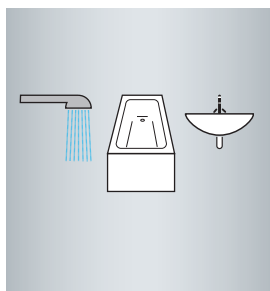
۱۴/۷ لیتر در دقیقه (۳۱kW)