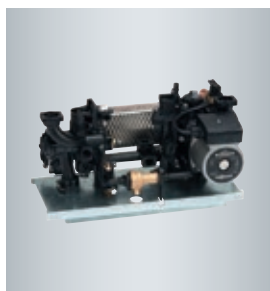
سیستم هیدرولیک Aquova Bloc